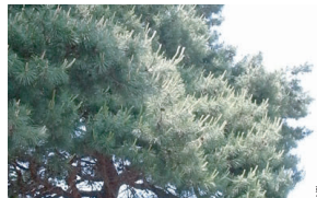
敷地脇にそびえる松の太木

100年以上の歴史を持つ邸宅のお庭が今回の敷地。古い門扉とその脇に堂々とそびえる松の木が印象的です。設計は、この樹を遺すことをスタート地点とし、できるだけまとまった共用部をつくりお庭のようなアプローチ空間とすること、また建物にも新たな緑を植えることを計画に盛り込んでいます（屋上緑化、ワイヤー緑化）。ただ樹木を保存するだけではなく、長い歴史に培われた吉祥寺の「緑とともにある暮らし」そのものを11世帯の新たな生活の場に継承していくことを目指します。