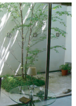
ドライエリアの施工事例

E住戸の一番の魅力は、地下1階南側に間口いっぱい広がるドライエリア。周囲を壁で囲われたプライバシー性の高い空間でリビングと一体に開放的な使い方ができ、また入居者自らで選んでもらったマイツリーをプランターではなく地植えができる計画としています。